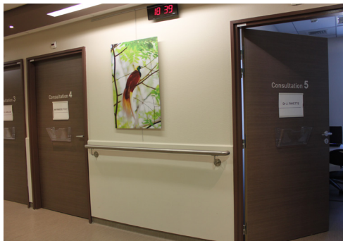
Les consultations de l'hôpital de jour

Vous remettez votre pochette rouge, jaune ou violette à l'aide-soignante qui vous attribue une méridienne, selon les disponibilités du service à ce moment-là.