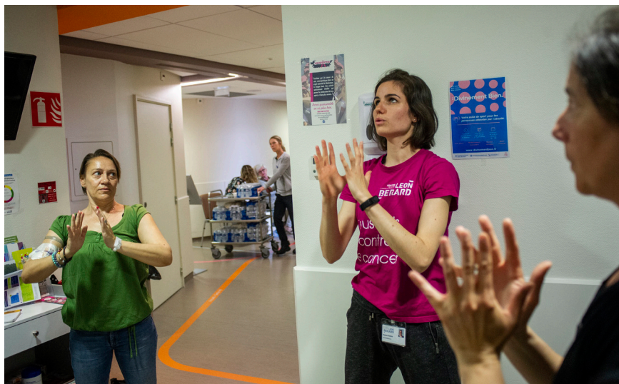
Un enseignant APA est présent à l'hôpital de Jour.