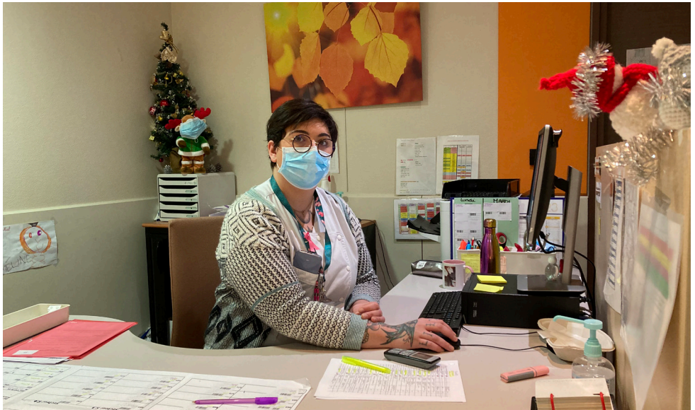
Le poste de l'aide-soignant où vous sera attribuée votre méridienne