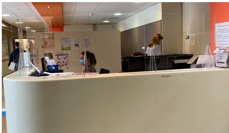
L'accueil de l'Hôpital de jour

Pochette Bleue : consultation PHASE 1, rendez-vous directement au secteur 1